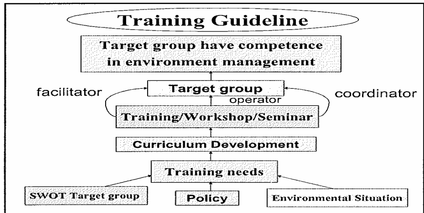
図2 研修ガイドライン

研修生の夏休みであったのか、研修生からの生の声を聞くことができず、残念でした。当センターの開所から既に 5,000 名以上の研修生を送り出し、その 1/3 は地方公務員であったと伺いました。また、タイだけでなく周辺国への協力も行っているとのことで、東南アジア地域における環境問題対策関連の拠点になっています。