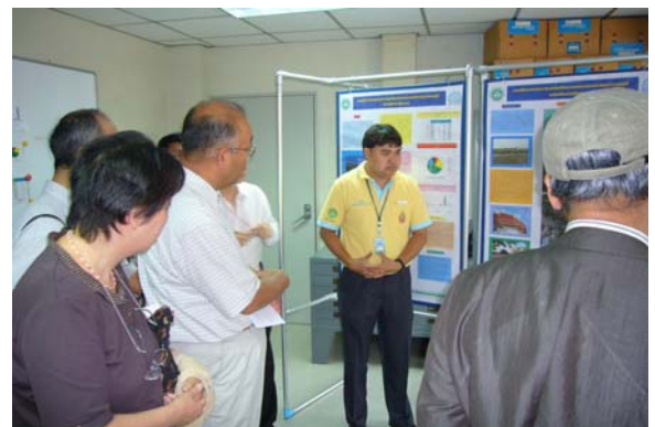
写真3 騒音振動研究室