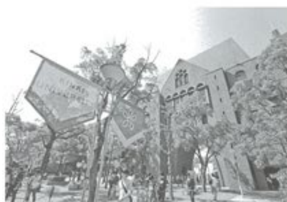
東大阪キャンパス西門

また研究面では、世界で初めて成功したクロマグロ完全養殖による「近大マグロ」や、コーヒーかす・茶かす等の不用となったバイオマスを原料とする次世代バイオ・リサイクル燃料「バイオコークス」、産学連携で運営する全人工光型植物工場等、環境にも配慮した多彩な研究が高い評価を受けています。