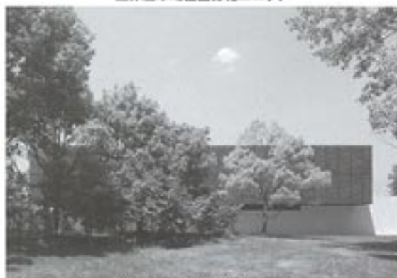
奈良キャンパス第2共同実験棟