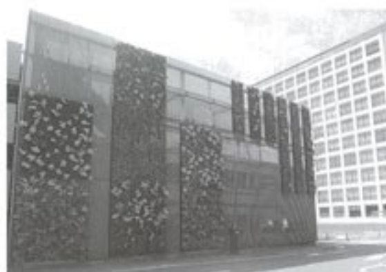
立体駐車場壁面緑化ユニット

奈良キャンパスでは、第2共同実験棟の壁面に、杉芯材をかごに入れて吊るすデザインを施しました。研究特性上、窓を設けることができない建物において、空調負荷の軽減、外壁の紫外線劣化保護、遮し・消臭・消毒効果をもたらしています。デザイン性、機能性にすぐれただけでなく、余廃材を建築に転用するという新たなサイクルを提示した建物でもあります。